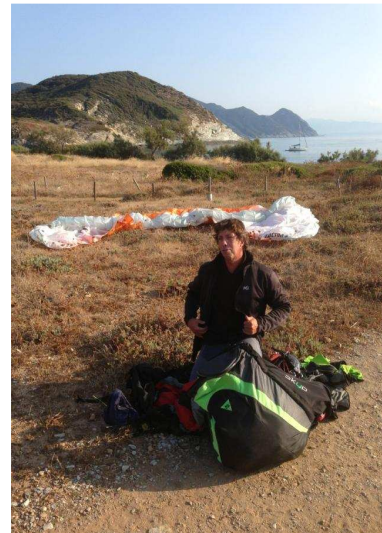
Atterro à Centuri