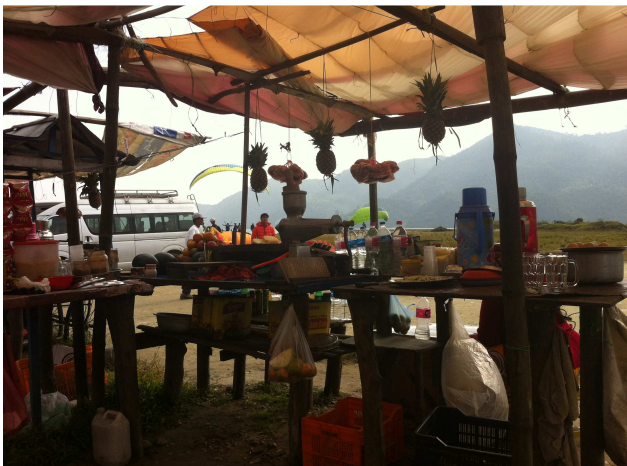
Le déco photo du haut – L'atterro et ses marchands ambulants photo du bas